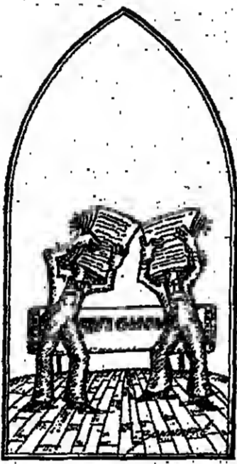
(Dessin de Bonnard.)